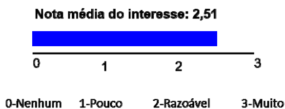
Figura 2. Nota média do interesse dos respondentes em cursar Agronomia no Ifes Campus de Alegre.