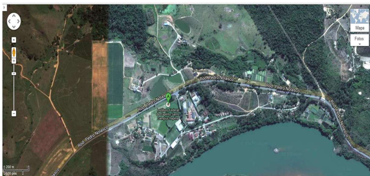
Figura 01: Vista aérea do IFES – campus Itapina

O conjunto arquitetônico do IFES Itapina é constituído atualmente de 134 imóveis totalizando uma área construída de 29.344,90 m 2 e 16.733,00 m 2 de campo e quadras, distribuídos em núcleos e setores numa área rural de 2.959.108,726 m 2 , aproximadamente 61 alqueires.