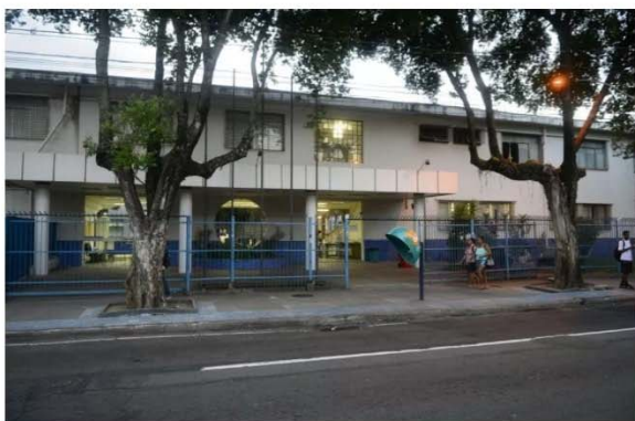
Ifes campus Vitória

Para concorrer ao cargo é necessário possuir graduação em Letras/Libras ou graduação acrescida de certificação de proficiência em tradução e interpretação de Libras.