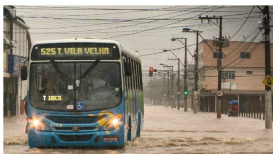
Ônibus do Transcol sofre alterações por conta de chuva na Grande Vitória

A chuva, que causa transtornos na Grande Vitória e no interior do Espírito Santo , também provocou suspensão e alteração de serviço nos municípios atingidos. Nesta sexta-feira (9), rotas de linha do Sistema Transcol foram alteradas e aulas foram suspensas no município de Vila Velha, na região metropolitana.