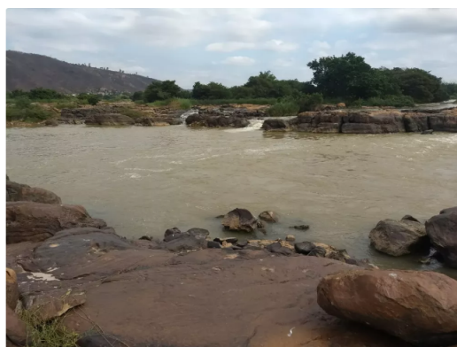
Rio Doce em Aimorés desapareceram nas águas

Além de quatro militares de Resplendor (MG), dois bombeiros de Colatina (ES) estão em Minas Gerais ajudando as buscas pelos outros dois rapazes que continuam desaparecidos.