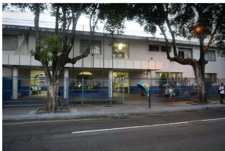
Aprovados poderão trabalhar no Ifes de Vitória ou outros campus

Os candidatos aprovados poderão trabalhar em qualquer campus da instituição ou no Centro de Referência em Formação e em Educação a Distância (Cefor).