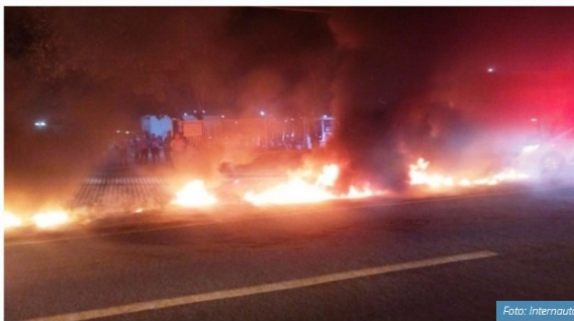
Bloqueio em frente a viação de ônibus, na pista lateral da BR 101, em Linhares

Em Linhares , o protesto começou por volta de 4 horas. Manifestantes colocaram fogo em pneus na entrada da Viação Joana D'Arc, que faz o transporte público no município e outras cidades da região, e impediram a saída dos ônibus. Por conta disso, os veículos só foram para as ruas com mais de uma hora de atraso.