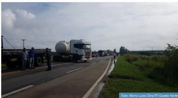
Caminhão faz manobra na BR 101, em São Mateus, para sair do bloqueio de manifestantes

Por conta do bloqueio na rodovia, havia muito trânsito no local. Discussões entre motoristas que queriam seguir viagem e os manifestantes que impediam a passagem foram registradas no local. Alguns motoristas tentavam sair das filas e fizeram manobras em plena BR 101 para voltar de onde saíram.