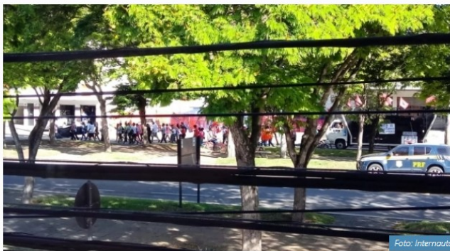
Manifestantes protestam na pista lateral da BR 101, em Linhares

Em Linhares , o protesto começou por volta de 4 horas. Manifestantes colocaram fogo em pneus na entrada da Viação Joana D'Arc, que faz o transporte público no município e outras cidades da região, e impediram a saída dos ônibus. Por conta disso, os veículos só foram para as ruas com mais de uma hora de atraso.