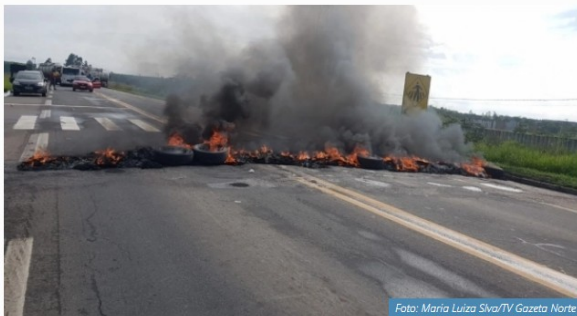
Bloqueio da BR 101, em São Mateus

Manifestações acontecem na rodovia em São Mateus e Linhares. Em Colatina, acontece uma passeata no Centro da cidade