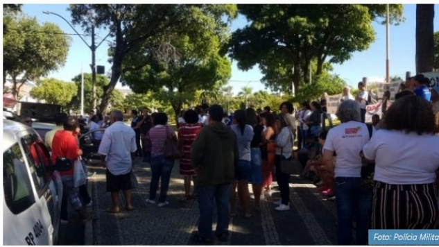
Concentração de manifestantes em frente à Prefeitura de Colatina

Em Colatina , na região Noroeste do Estado, manifestantes se concentraram em frente à prefeitura e seguiram em passeata pela cidade. Segundo a Polícia Militar, as pessoas deram a volta no prédio da prefeitura e depois seguiram para a Câmara Municipal. O protesto foi pacífico e acompanhado de perto pelos policiais.