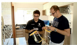
Professores produzem em casa máscaras em impressora 3D para doação no ES.

Em meio à pandemia do novo coronavírus, a solidariedade também está ganhando destaque, especialmente para ajudar na prevenção à doença. Cinco professores do Campus Colatina, do Instituto Federal do Espírito Santo (Ifes), estão produzindo máscaras de proteção em uma impressora 3D para doar a profissionais de saúde na cidade. Para respeitar o isolamento, os professores estão produzindo os instrumentos em suas próprias casas.