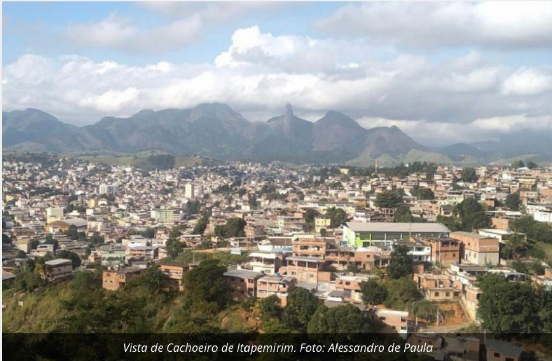
Vista de Cachoeiro de Itapemirim.

https://www.diaadiaes.com.br/cachoeiro-volta-ao-risco-moderado-no-mapa-da-covid-19-saiba-o-que-muda/