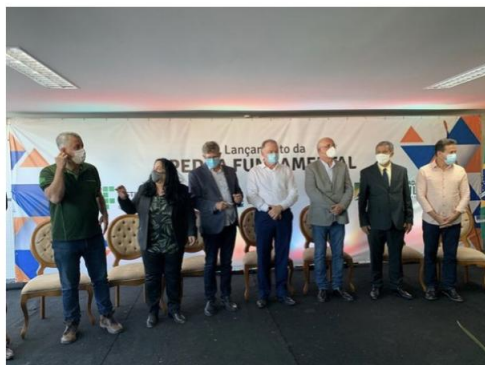
Cerimônia de lançamento da pedra fundamental do campus do Ifes em Presidente Kennedy teve participação do ministro da Educação, do governador do ES e de parlamentares.

O município de Presidente Kennedy, no Sul do Espírito Santo, vai ganhar um campus do Instituto Federal do Espírito Santo (Ifes). O anúncio foi feito pelo ministro da Educação, Milton Ribeiro, que nesta quinta-feira (19) esteve na cidade para lançar a pedra fundamental da obra. No entanto, a construção será totalmente bancada pela prefeitura.