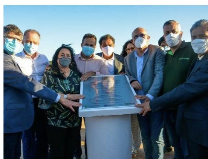
A solenidade de lançamento aconteceu na EMEIEF Barra de Marobá.