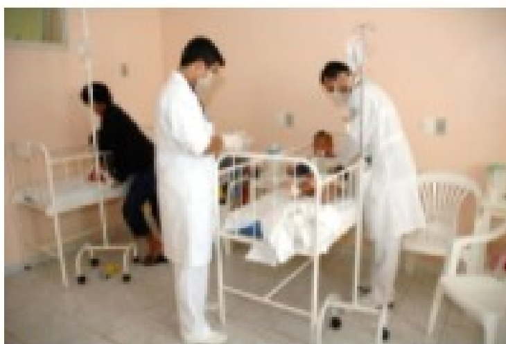
Hospital Maternidade São José atende a 32 municípios do estado e conta com 216 leitos.

Referência na área de obstetrícia, pediatria, cardiologia e oncologia, o Hospital Maternidade São José, que atende a 32 municípios do Estado, é um dos sete existentes em Colônia. Ele conta com 216 leitos e realiza uma média de 5 mil atendimentos de pronto-socorro (PS) obstétrico; 12 mil, pediátricos; e cerca de 4,5 mil partos no ano. Junto ao Hospital Sílvia Avidos, atua no combate ao coronavírus.