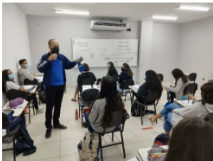
Alunos da Unipro em 2021 seguem professoras dentro o Centro 10

A ideia consiste em uma plataforma online ( acesse aqui ) com informações sobre os cursos técnicos integrados ao Ensino Médio que são oferecidos em todos os campi da Grande Vitória e também em Guarapari e Aracruz.