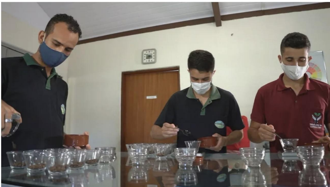
Instituto Federal do Espírito Santo tem o primeiro curso técnico de café do Brasil