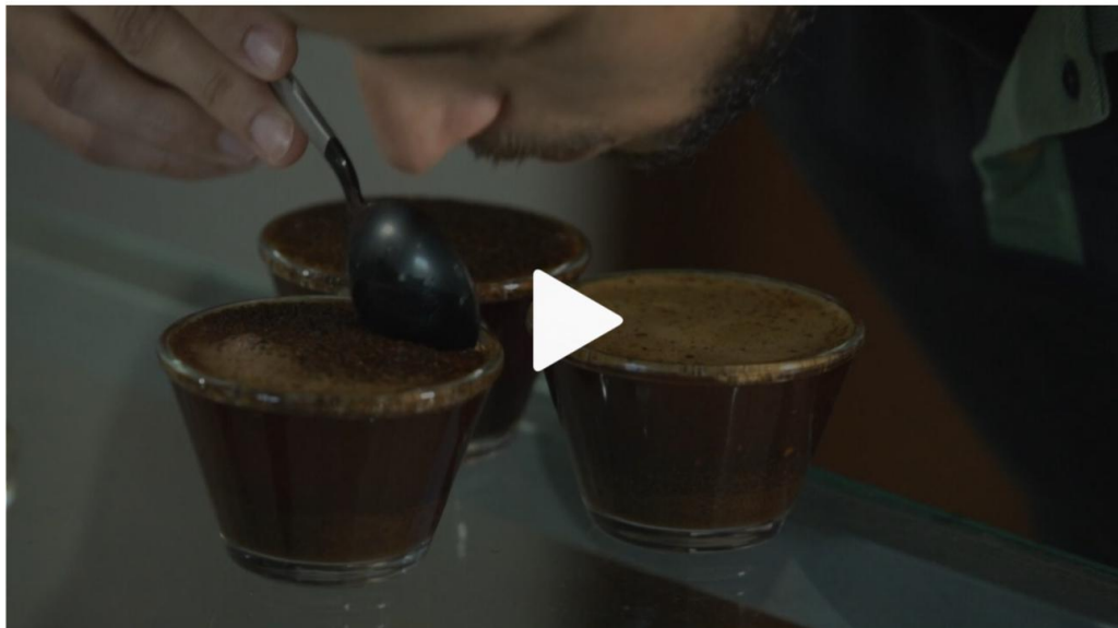
Instituto Federal do Espírito Santo tem o primeiro curso técnico de café do Brasil

O gosto pelo café vai muito além do prazer de consumir a bebida. Pelo menos para os alunos do curso técnico de café do Instituto Federal de Ensino do Espírito Santo (Ifes). A instituição capixaba, que fica na cidade de Alegre, no sul do estado, é a primeira a oferecer especialização sobre café no Brasil.