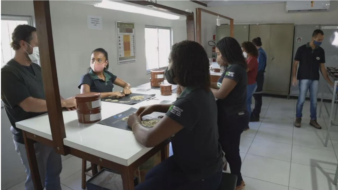
Instituto Federal do Espírito Santo tem o primeiro curso técnico de café do Brasil