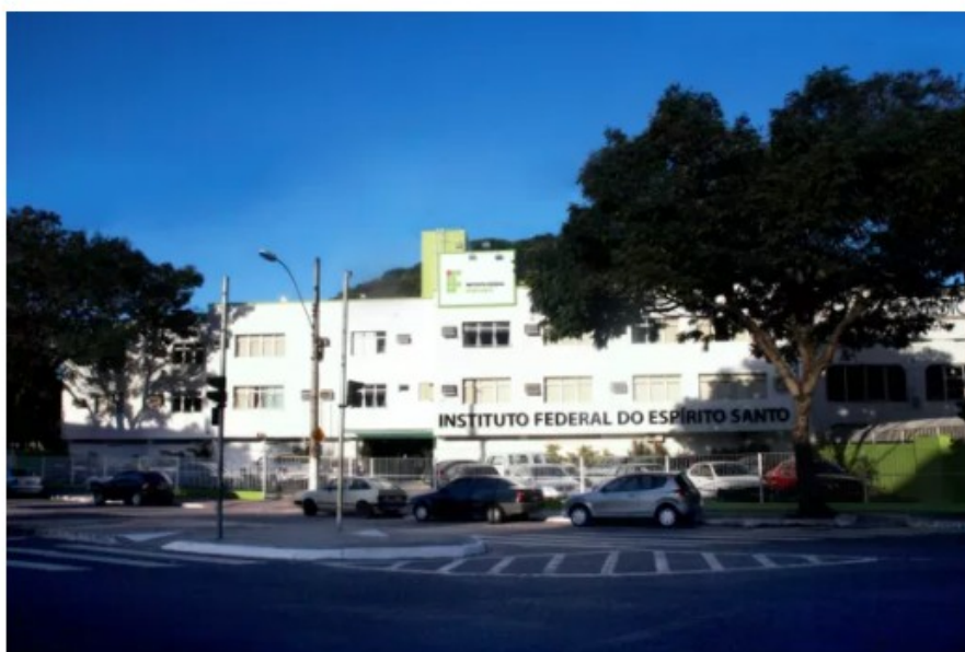
Reitoria do Ifes, em Vitória

A carga horária dos técnicos administrativos contratados será de 40 horas. A remuneração é de R$ 1.945,07, para nível C; de R$ 2.446,96, para nível D; e de R$ 4.180,66, para nível E. Para todos, haverá auxílio-alimentação no valor de R$ 458,00, podendo ser acrescidos, ainda, auxílio-transporte, assistência à saúde suplementar e auxílio pré-escolar, quando couberem.