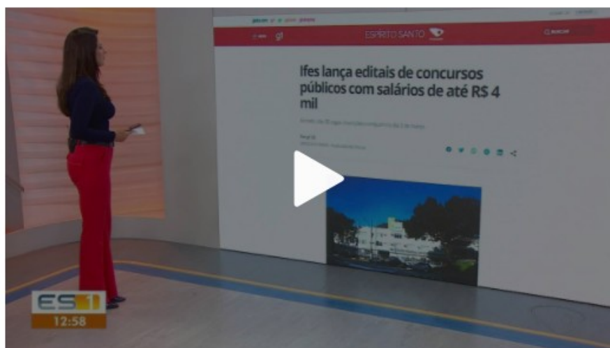
Ifes lançou editais de concursos públicos com salários de até R$ 4 mil

Foram lançados dois editais de concursos públicos para preenchimento de vagas no Instituto Federal do Espírito Santo (Ifes) . Os salários chegam a R$ 4 mil.