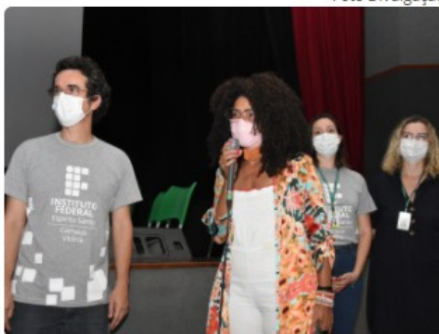
Solenidade de início do acordo de cooperação entre a Seme e o Instituto Federal de Educação, Ciência e Tecnologia do Espírito Santo (Ifes). 🔍