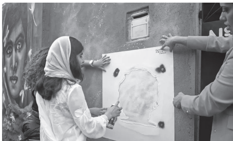
Malala Yousafzai helps stencil a graffiti design of Marielle Franco on the wall of a Rio favela.